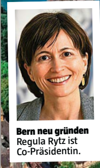
Bern neu gründen Regula Rytz ist Co-Präsidentin.