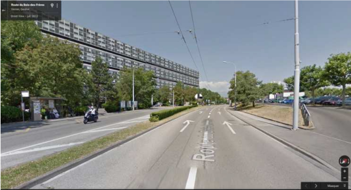
Exemple : Avant (ci-dessus) et après (ci-dessous) les nouveaux aménagements.